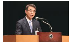
記念特別講演会での様子