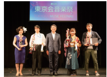
東京会音楽祭表彰式にて